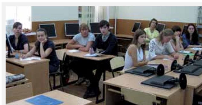
Den första gruppen av FORPEC-studenter i den nyrenoverade PC-lokalen.

Framtiden för samarbetet kan betraktas som ”lovande men skrämmande”. Det finns goda skäl att tro på ett fortsatt fruktbart samarbete. STA välkomnar svenska studenter att delta i kurser i S:t Petersburg eller att skriva examensarbete i Ryssland. För att det ska kunna realiseras krävs dock en ändrad attityd hos de svenska jägmästarstudenterna, de måste vara villiga att lämna