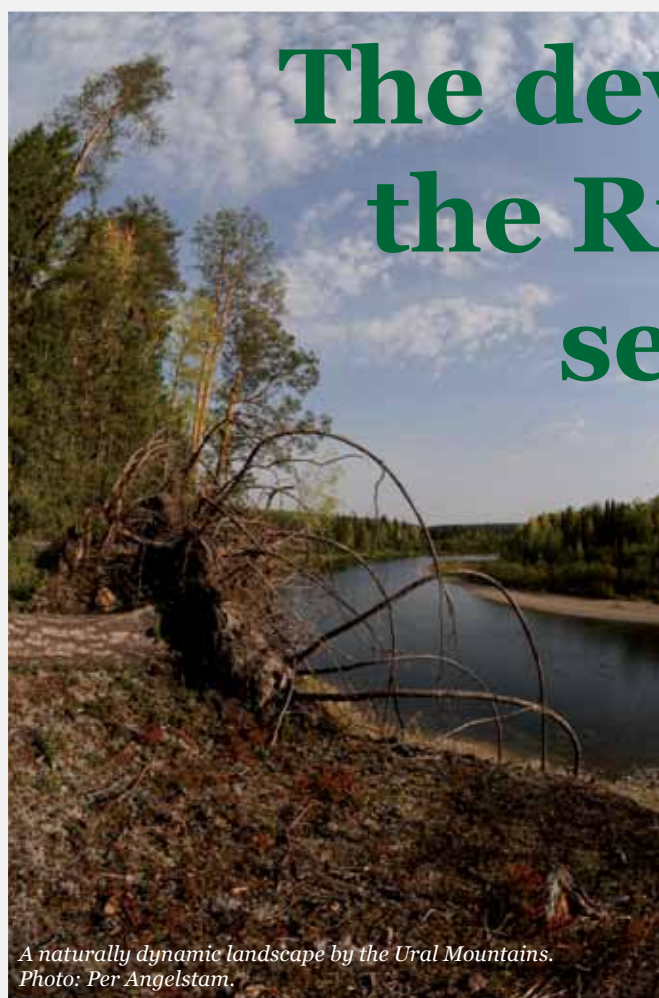
A naturally dynamic landscape by the Ural Mountains.

Main challenges for a successful development of the Russian forest sector are related to the availability of funding, to increased production of wood products with high added value, and to the present overuse of accessible forest.