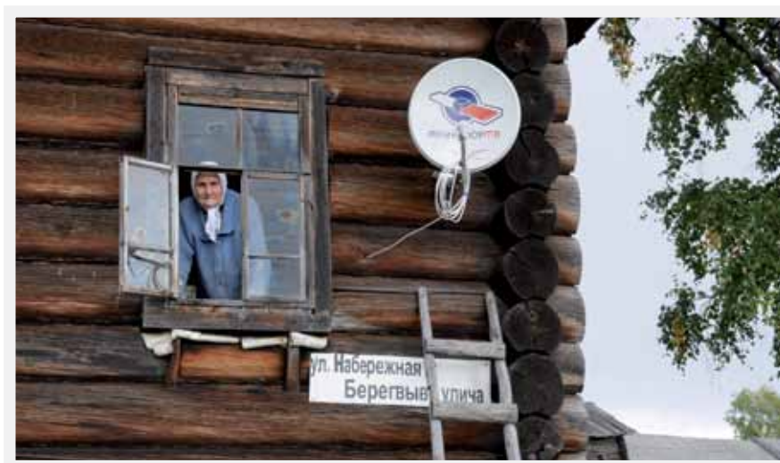
Landsbygden i Komi bebos av en äldre befolkning.

När trakthyggesbruk lanserades i stor skala i Norrland i och med 1948 års skogsvårdslag, kunde man förutse en framtida ålderssvacka. Därför lanserades en lång rad statliga åtgärder och bidrag gavs bland annat till plantering, vägbyggen, dikning och skogsplanläggning. Dessutom åtog sig skogsföretagen själva att avverka den mindre växtliga äldre skogen först och att ransonera den