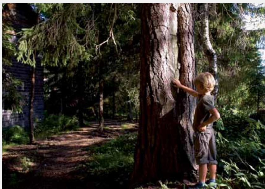
Resin collection has always been an important part of Russian forestry. Photo: Ola Jennersten.

THE PLAN OF NEW LEGISLATIVE initiatives prepared by the Federal Forestry Agency includes a draft federal law on making changes in the Forest Code. The main task is to combat illegal logging and to preserve and to protect