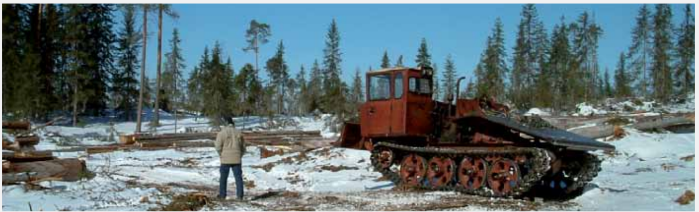
TDT55 tillverkas fortfarande i Petrozavodsk. Dags att lämna gamla metoder för avverkning och skötsel?

I Sverige skapar vi genom gallring slutavverkningsbestånd som är relativt jämna ifråga om trädslag, dimensioner och kvalitet. Vi tänker nog sällan på att en förutsättning för ett sådant skogsbruk är att det finns jämnt utspridda fabriker som efterfrågar gallringsvirket. Så är inte fallet i nordvästra Ryssland. I hela Arkhangelsk län (skogsareal 22,3 miljoner hektar) finns bara två områden med massaindustrier; Arkhangelsk i norr och Kotlas i sydöst. I Komi (skogsareal 30 miljoner hektar) finns