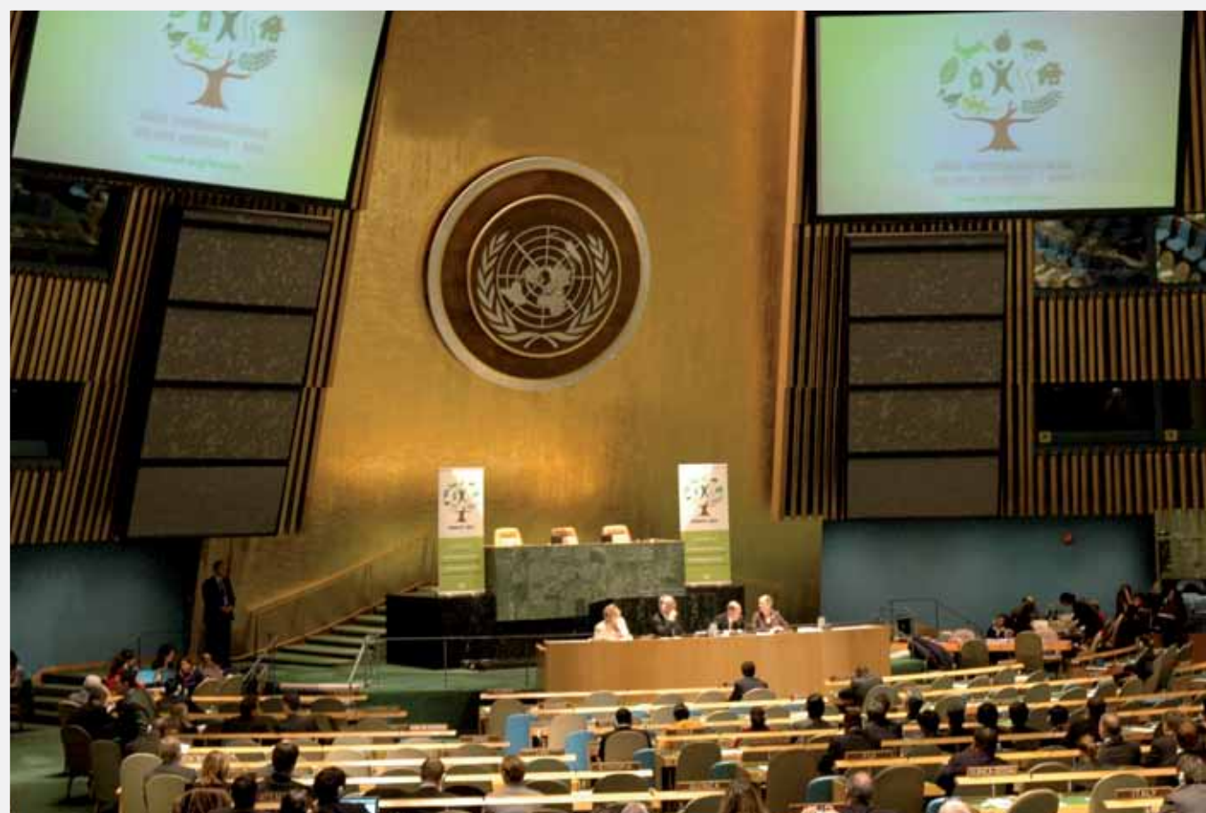
Lanseringen av det Internationella Skogsåret 2011 skedde under UNFF 9.