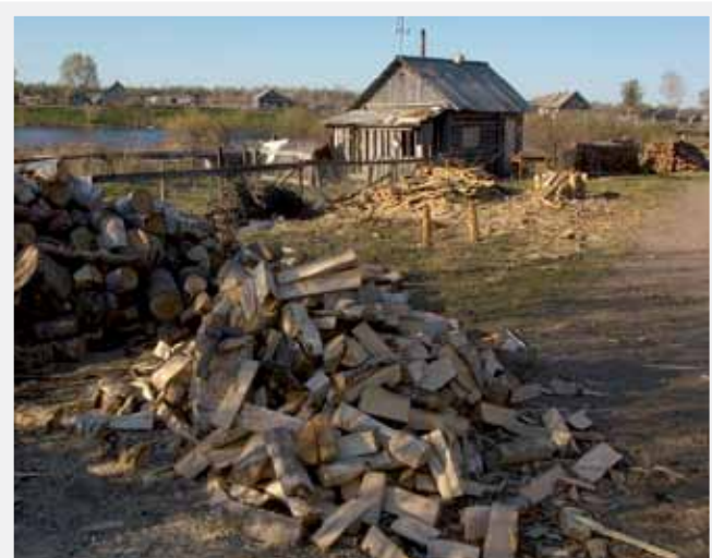
Aspen firewood in a village in Karelia.

TAKING INTO ACCOUNT the described situation, WWF in Russia is implementing a variety of activities to overcome existing problems in the area of illegal logging and trade elimination. In on-going projects, WWF is involved in intensive work on forest policy and legislation improvement, work on responsible business development ensuring legality of wood and wood products and promoting FSC certification in Russia, and on work on awareness raising, education and training. ○