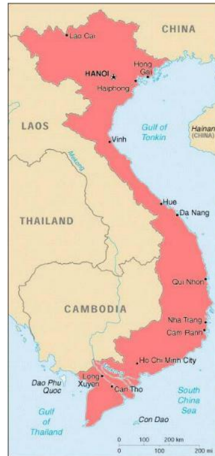
Figur 1. Bai Bang ligger cirka tio mil nordväst om Hanoi.

För att identifiera situationen kring Bai Bang har källor i form av förhandsgranskade artiklar, rapporter utförda av fristående institut på uppdrag av Sida, samt annat material använts. De publicerade artiklarna är förhandsgranskade och bör hålla en hög reliabilitet. En rapport från SIFI (Hallenberg, 2013) bidrar med en dagsaktuell tillbakablick av läget. Minnesanteckningar från ett ”Runda bords-samtal” med Norén et al. (2011) ligger till grund för en stor del av svaren under rubriken ”Framtida utmaningar”. Från samtliga källor har vi försökt skapa oss en egen bild av situationen i Bai Bang, knuten till den aktuella frågeställningen.